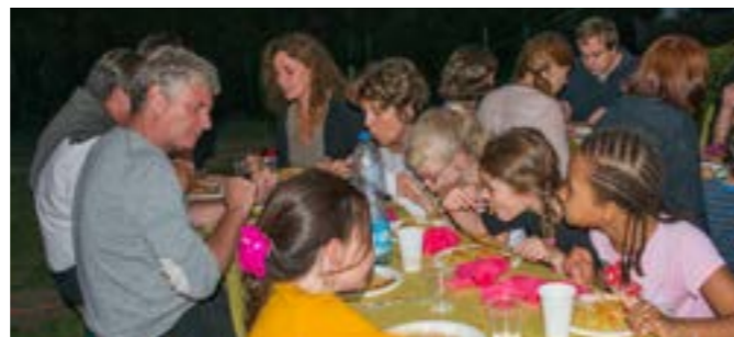
De belles tablées !