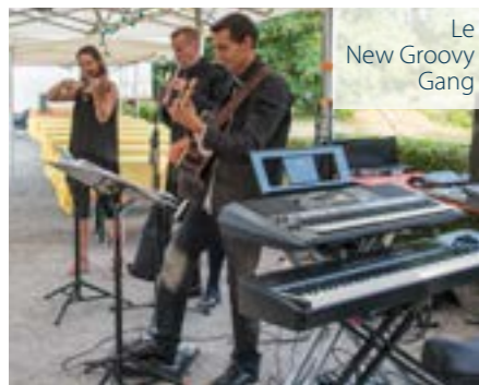
Le New Groovy Gang