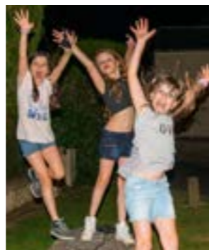
A l'année prochaine !