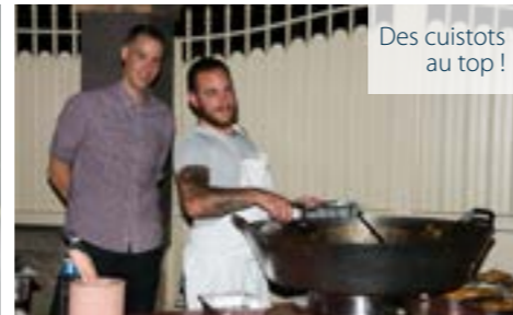
Des cuistots au top !