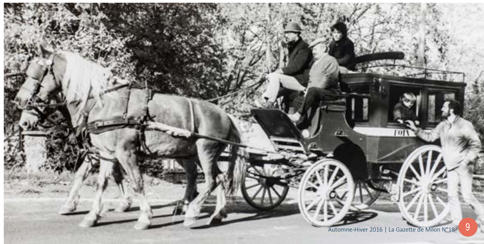
Automne-Hiver 2016 | La Gazette de Milon N°18