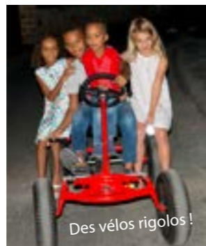
Des vélos rigolos !