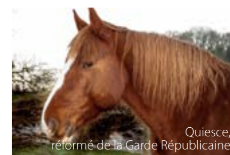
Quiesce, réformé de la Garde Républicaine