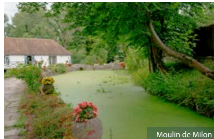
Moulin de Milon

Sur la rive gauche de cette parcelle se situe un étang et le propriétaire, après l'accord de la DDT et sur conseil d'une entreprise spécialisée, a décidé de procéder au curage de l'étang et à l'abattage d'aulnes ayant complètement envahi cette prairie. Pour information, cette prairie est classée «à reconquérir» dans l'ancien POS de Milon et dans notre futur PLU.