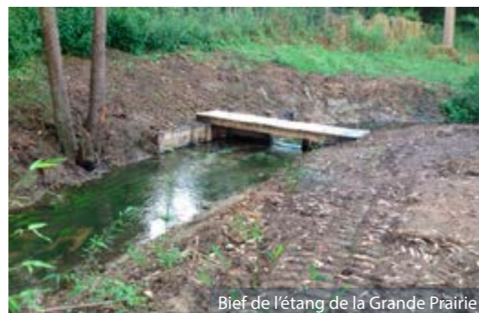
Bief de l'étang de la Grande Prairie