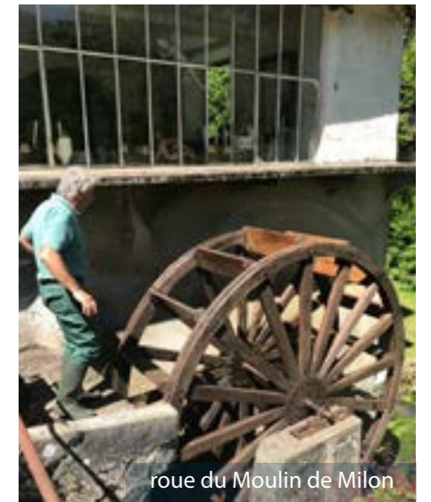
roue du Moulin de Milon