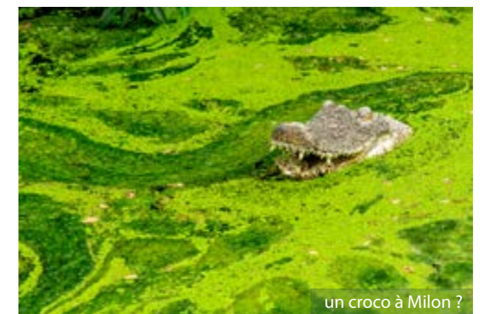
un croc à Milon ?