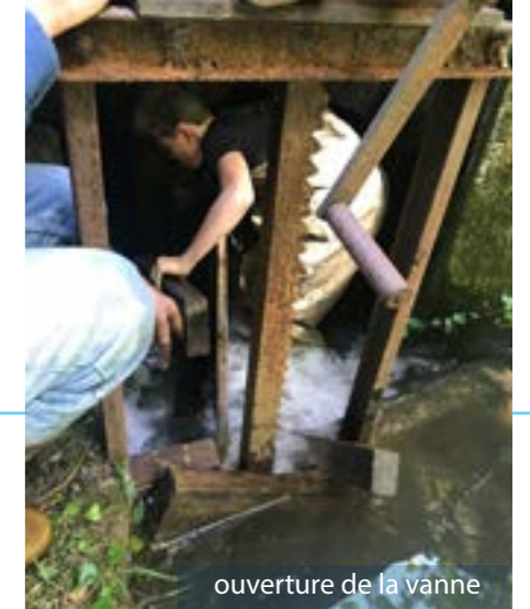
ouverture de la vanne

Ces travaux permettront de réalimenter le Moulin de la Mare qui n'est hélas plus en état. La roue avait été remplacée par une turbine affectée à la laiterie et à la production d'électricité pour toute la ferme.