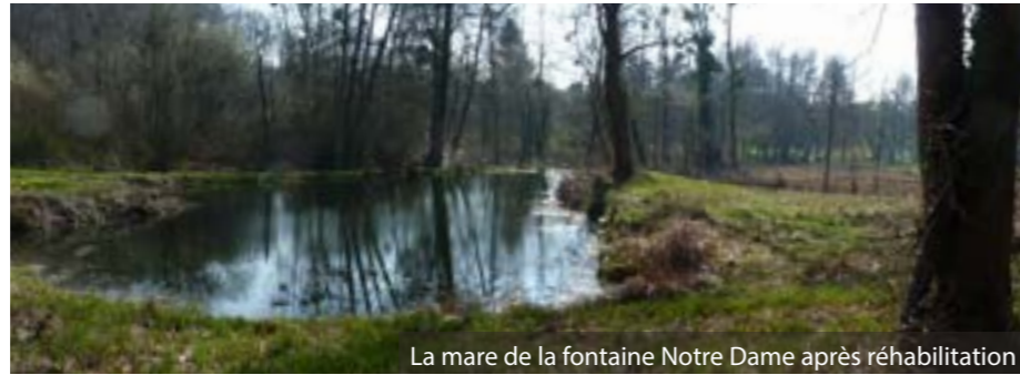
La mare de la fontaine Notre Dame après réhabilitation

Dans une précédente édition de la Gazette de Milon, nous vous parlions de la restauration de la mare de la Fontaine Notre Dame .