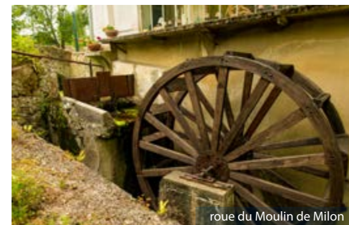
roue du Moulin de Milon

Le conseil municipal et les Milonais s'associent pour remercier les propriétaires qui ont fait cet investissement contribuant ainsi au maintien de notre patrimoine et au bien-être dans notre village.